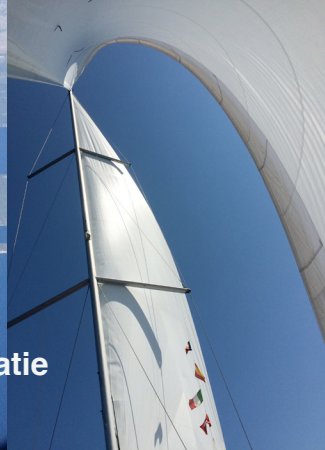
îles dalmates / croatie septembre 2015